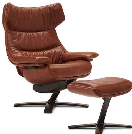
■ Vers. 704