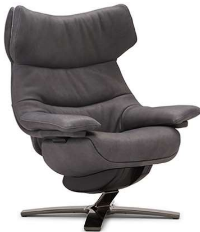
■ Vers. 703