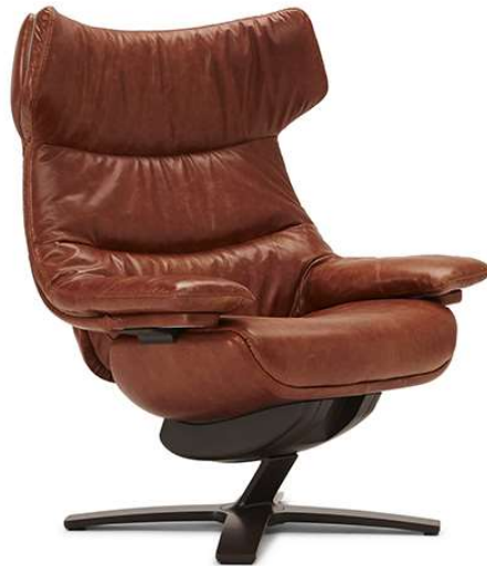
■ Vers. 703