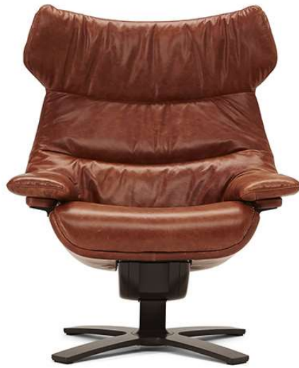
■ Vers. 703