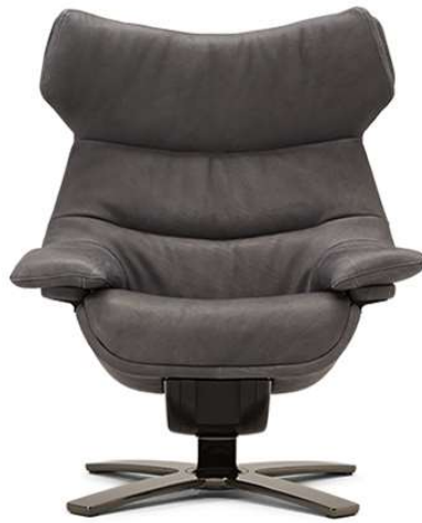
■ Vers. 703