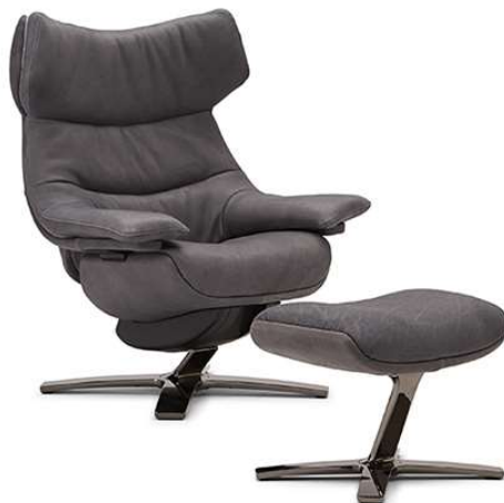
■ Vers. 704